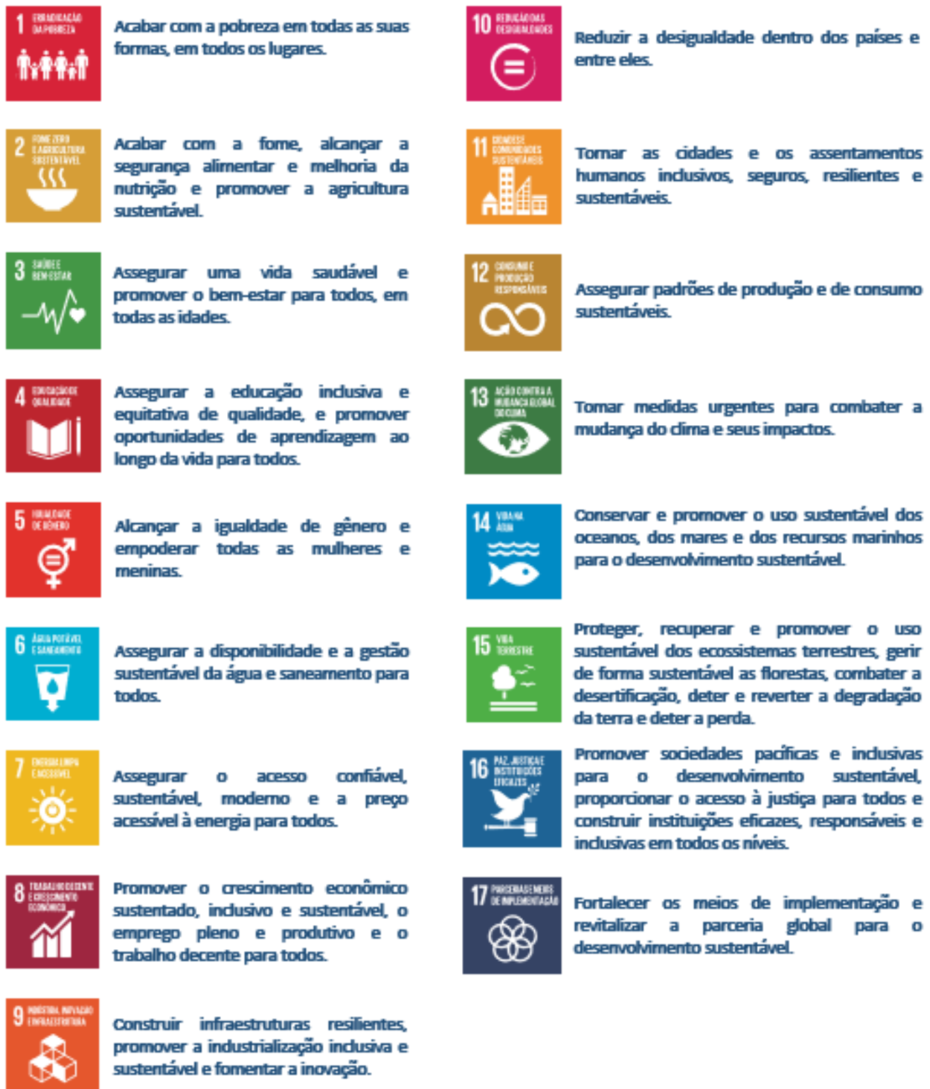
Figura 1. Objetivos de Desenvolvimento Sustentável – Agenda 2030 ONU