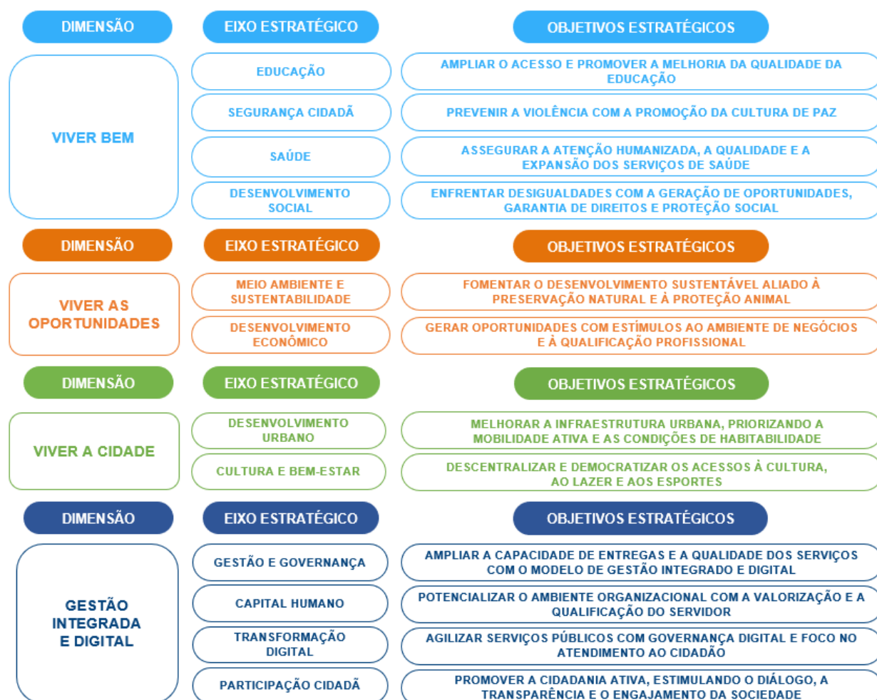
Quadro 2 - Correspondência entre as Dimensões, os Eixos e os Objetivos:

São 12 (doze) os Eixos Estratégicos: Desenvolvimento Social, Meio Ambiente e Sustentabilidade, Desenvolvimento Econômico, Segurança e Prevenção à Violência, Participação Cidadã, Cultura e Bem-Estar, Desenvolvimento Urbano, Educação, Saúde, Transformação Digital, Gestão e Governança e Capital Humano.