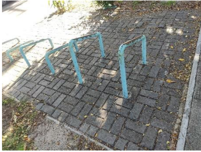
Foto Praça Thiago Pepeta, Rua Frei Cassimiro, 804 - Santo Amaro, Recife.