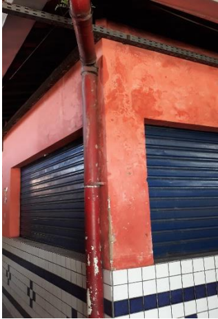
Foto Mercado Público de Santo Amaro, Av. Cruz Cabugá, 1933 - Santo Amaro, Recife.