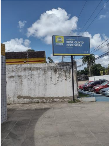
Foto do Centro de Saúde Olinto Oliveira, R. Francisco de Paula Machado, 47 - Caxangá, Recife.